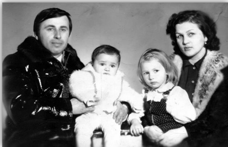
С супругой и детьми