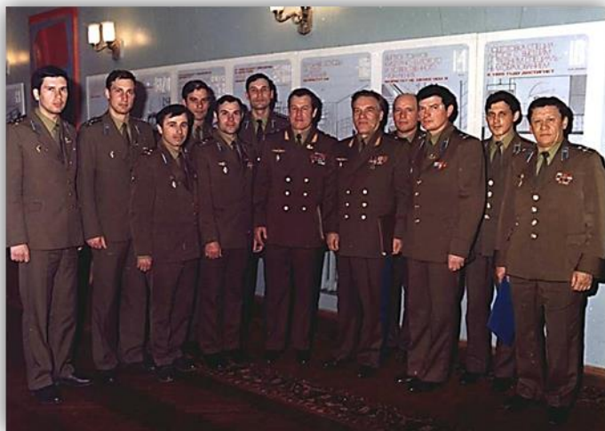
В генштабе с коллегами