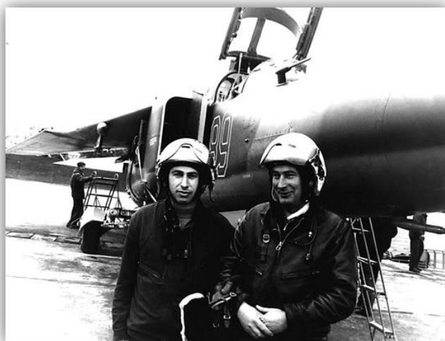
После полета с коллегой