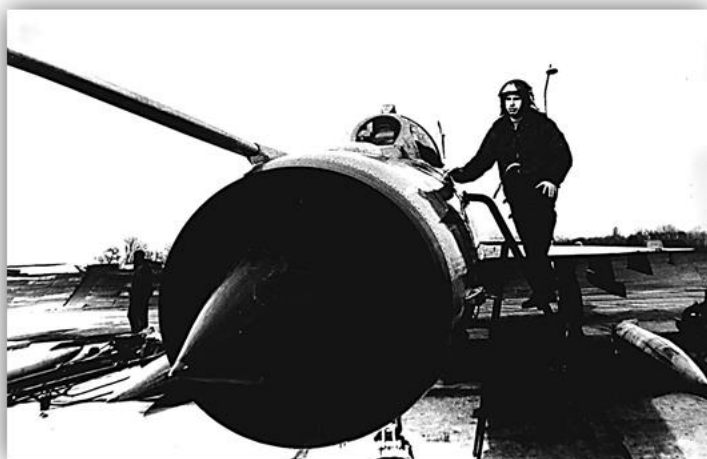
На крыле самолета