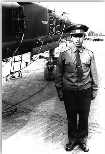
Молодой у самолета