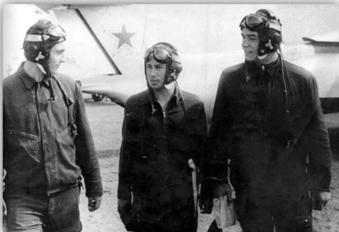
После полета с коллегами