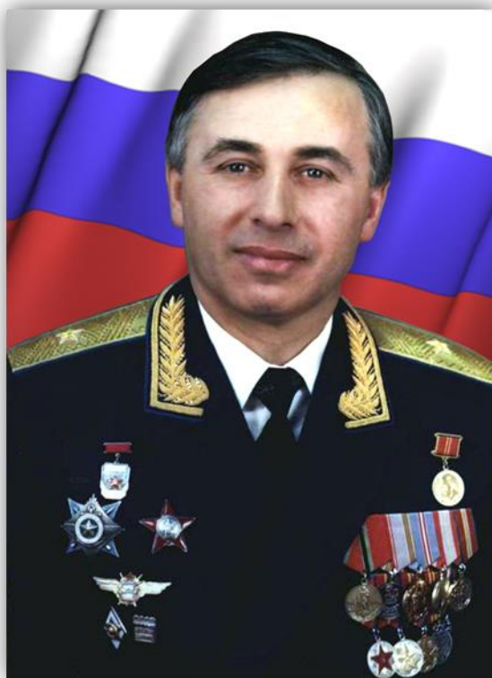
Первый Герой России С. С. Осканов