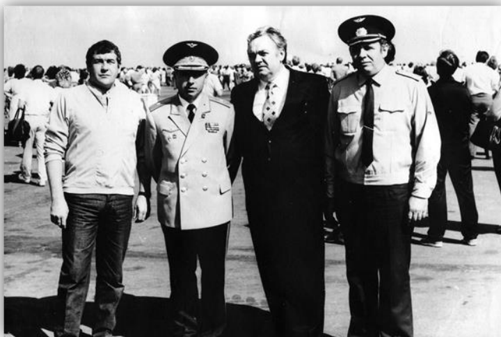
С ген. конструктором