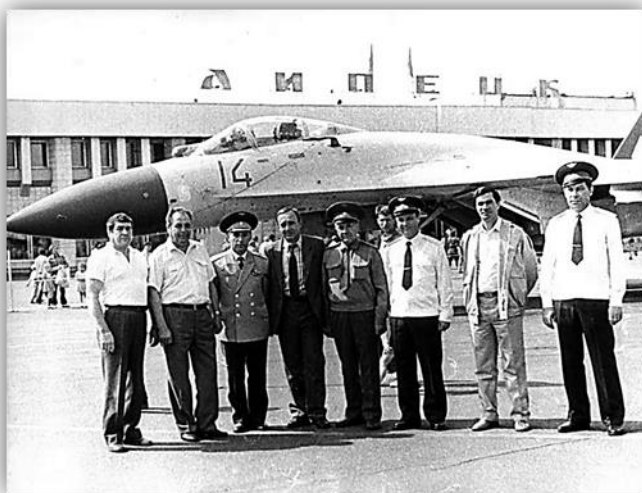
С коллегами, г. Липецк